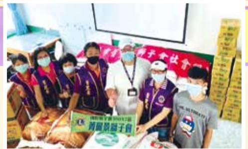
青麗景獅子會幫助華夏資助弱勢學童