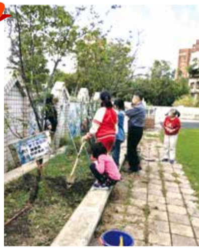
■孩子在夢土田收成，並與校長分享果實。

踏實。更從中學習唯有經過努力和腳踏實地，一步一腳印耕耘，夢想才会有開花結果的一天。在這個小田園中，希望的幼苗正在孩子的心中慢慢萌芽。感恩華夏公益協會及其他外部的慈善單位，慨予提供物資或獎助金，在黑暗的角落裡，點亮一盞明燈，適時讓學校能給予弱勢家庭經濟援助。☀