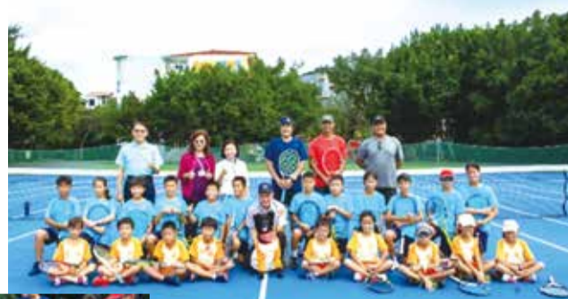
■黑皮和主任網球學生、教練合影

在家訪的案例中，文林校犬黑皮的故事，影響孩子，讓弱勢家庭的孩子也收養流浪狗，並且取名為「黑皮」，並且穿上家中升學後孩子留下來的校服。在家訪的過程當中，母親為負擔家中經濟重擔，從事約聘雇的職業，一家四口的生活較為窘迫。這份助學關懷，讓社會上需要被幫助的家庭感受社會的溫暖，接受助學金的孩子以及家庭，如同孩子在學校與黑皮互動後，也收養流浪狗所付出的實際行動，未來，當他們有能力時，也會在世界上普灑「愛與happy」。☀