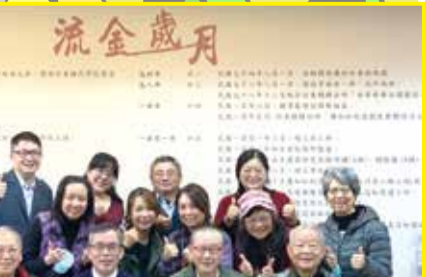
訪視新竹大同國小