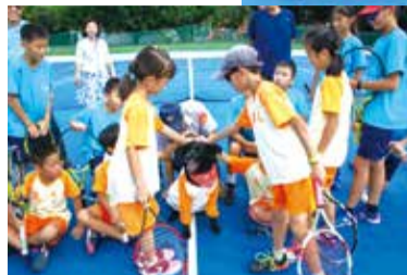
■黑皮和打網球的孩子互動