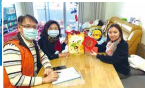
■家訪送上華夏社會公益協會助學金和福袋