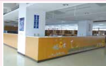
■圖書館服務臺施工前的高度，緊貼著冷氣的開關處，其高度不適用於服務人員與孩子的互動。服務臺降低了40公分，成了圖書館與孩子互動的第一線。

從閱讀的角度，往往我們買了一套書回來，就希望孩子能把這套書看完，但事實上您會發現，大部份的孩子是東翻一頁、西翻一頁，除非有章節或故事內容順序，否則孩子不會規規矩矩的從第一頁看到最後一頁。但父母們就擔心他們疏漏了某些部份沒有看到。這樣