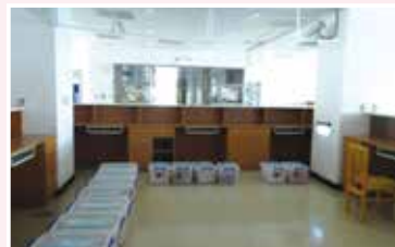
■整修前，服務臺高度不適用因而閒置成了物品堆放處。整修後，服務人員進駐服務臺，與孩子有了親切的互動成了匯集人氣的地方。