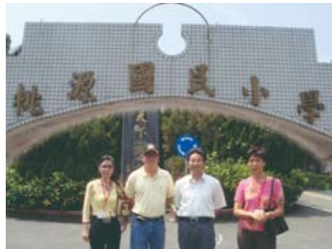
至桃源國小參訪並實際了解營養午餐狀況。

綜觀上述資金需求，協會的現有募款仍是不足的，謹此再次呼籲「100、200不嫌少，發揮愛心大家一起來。」