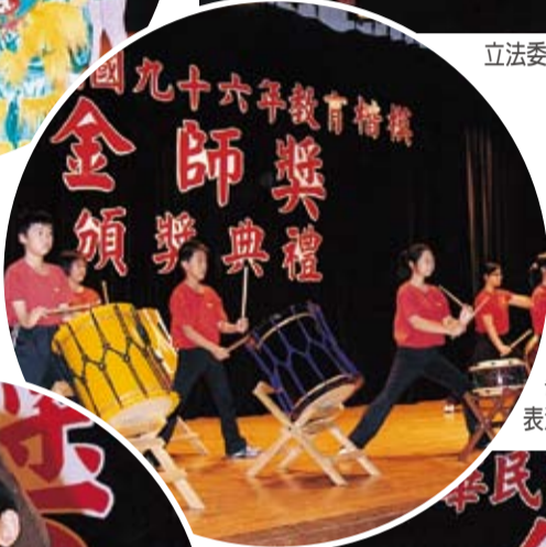
中華音體教育發展協會的太鼓表演揭開序幕。