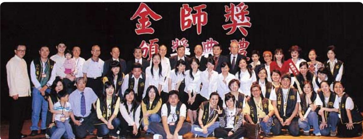
此次金師獎頒獎典禮所有工作人員於會後合影，也為此次大會圓滿落幕畫下句點，期待明年再見。