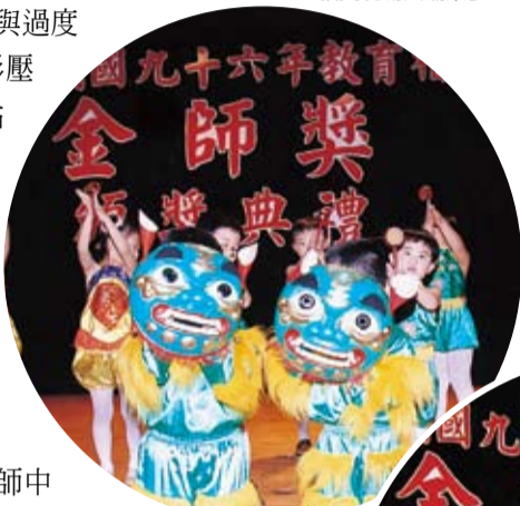
精湛幼雅圓可愛的小朋友們，熱鬧的廟會表演。