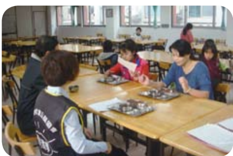
志工與小朋友一起用早餐

臺北市教育局對弱勢兒童除有午餐補助外，也提供每位弱勢兒童每餐15元的早餐補助，除此之外華夏社會公益協會也提供每位弱勢兒童每餐10元的早餐補助，有了政府及民間單位的協助加上學校的支持，開始試辦學童早餐，讓這些弱勢學童不再餓肚子上學。因雙園國小具地利優