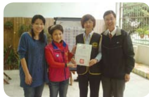
雙園國小校長（右一）致贈感謝狀予本會

華夏社會公益協會對於弱勢學童的關懷不只是贊助學童早餐，在寒暑假期間推動春節飽飽及陽光飽飽活動，讓人感受到華夏社會公益協會對弱勢族群的照顧是持續不間斷的付出。華夏社會公益協會的愛心精神，將會帶動更多有愛心、熱心之人，散播更多溫暖愛心的「華夏種子」。