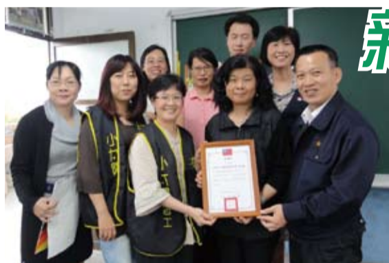
於竹北國小訪視學童早餐

『發揮教育公平正義』、『落實照顧弱勢學生』不是一句口號，唯有以最真誠的愛心去關懷協助弱勢的學生，用更多元的包容、更溫馨的尊重，找回弱勢學生應有的尊嚴，進而激發學生潛能，跳脫貧窮弱勢的漩渦，如何突破現有教育資源，結合社會公益團體能量，轉化變成「愛己愛人、犧牲奉獻」的教育大愛，是從事教育工作者人人都要重視的首當要務。☀