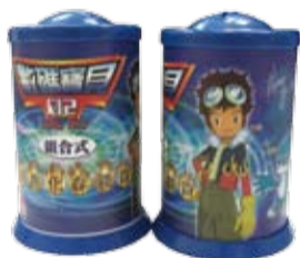
莞玉公司捐贈的存錢筒

特此感謝協會理事長、各位同仁的愛心贊助。我們會加油在異域的這片土地上，以愛心澆灌我們的幼苗，愛的教育花朵一定綻放在泰北的教育界！☀