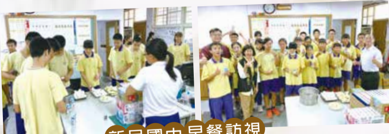
新民國中早餐訪視