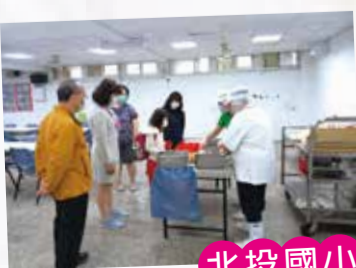
北投國小早餐訪視