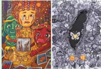
■好餓吃不到 一六美黃秋慧 ■逝·蝶 一五美王品翔

自信、發揮潛能。同時，因爲校長與家長積極募款，只要美術班孩子的作品，於在校四年，年年都能獲得刊載與收錄，獲得賞識與鼓勵。因此短短幾年來，本校美術班學生已在各項比賽獲獎連連，在臺北市學生美術比賽獲獎成績斐然，更連續四年在國中美術班招生中，全數上榜，今年更有第一屆的學長姊8位考上師大附中，足以見證我們東園美術班投入藝術教育與全人教育的努力。我們曾於青少年發展處舉辦畢業美展，在108、109年與臺北市鄉土教育中