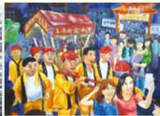
■青山夜巡—六美涂芸菲