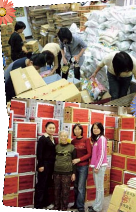
桃源國小志工群組裝福袋。