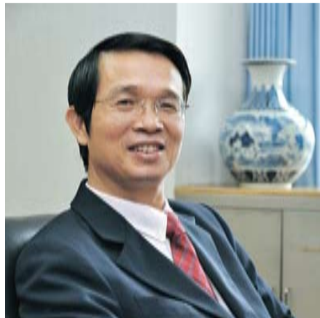
吳清山教授/臺北市政府教育局前局長