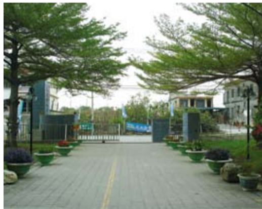
■經過長時間的清理整頓，校園已恢復原有乾淨的環境。