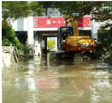
■八八水災讓羌園國小校園一片汪洋。

四個月後的今天，回首88水患的校園情景，災情已逐漸復原，陰霾也終將開展，而這一切的恩澤可說是來自於一絲絲的關懷與愛心、一縷縷的捐助與熱情所堆砌而成。當然！羌園國小的重建之路一定有「中華民國華夏社會公益協會」的腳印，有您真好！讓我們全校師生再次獻上誠摯的謝意，我們對您永懷感恩！謝謝您，也祝福您！☀