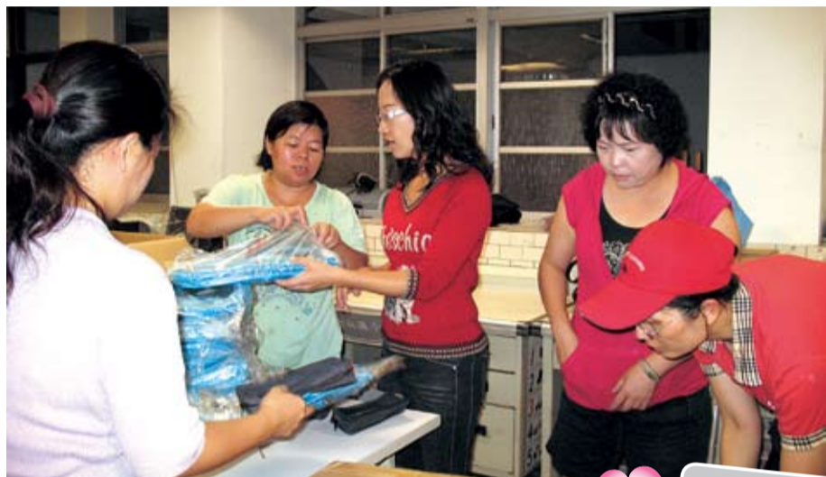
■士林國小志工們於該校教室組裝文具、筆袋放於書包內。

人在做，天在看，為了公，不自私，有能力有愛心的人，大家一起來，為社會弱勢家庭協助「陽光送暖，小雨滋潤」每個人由自己做起，讓社會和諧，每個家庭樂利安康。☀