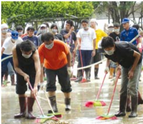
■災後校園的重建全賴各界的協助。